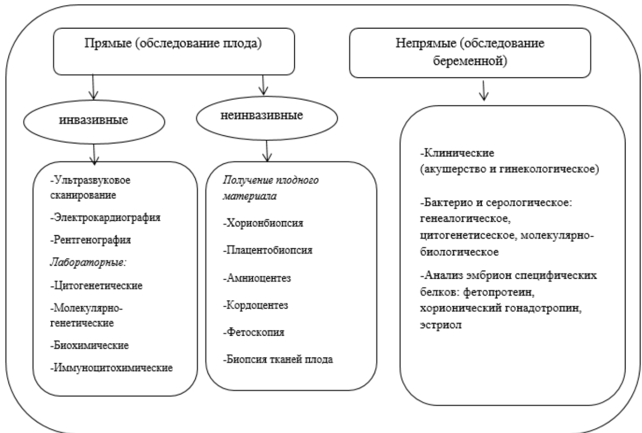
Рисунок 1. Алгоритм пренатальной диагностики развитие плода

При неинвазивном методе пренатальной диагностики ультразвуковое исследование применительно к беременности - это также один из способов оценить состояние плода без вторжения в полость матки. То есть - неинвазивно. Поэтому УЗИ можно считать методом пренатальной диагностики. При помощи УЗИ можно определить: беременность является маточной или внематочной; сколько плодов находится в матке - один или несколько; каков возраст плода (срок беременности) и нет ли отставания в его развитии; имеются ли у него видимые дефекты (пороки развития); какая часть плода предлежит к выходу из таза женщины голова или ягодицы; каков характер сердцебиения плода; - пол плода; где располагается плацента и каково ее состояние; каково состояние околоплодных вод; нет ли нарушений кровотока в сосудах плаценты; нет ли угрозы выкидыша.